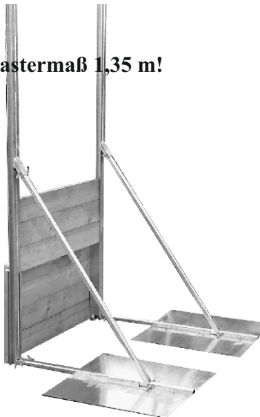
Abb. zeigt 2 Stck. L-Stütze mit Bodenplatte